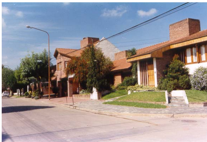
Fotografía 3: Area 2 – zona 1 – residencial de nivel socio-habitacional alto.