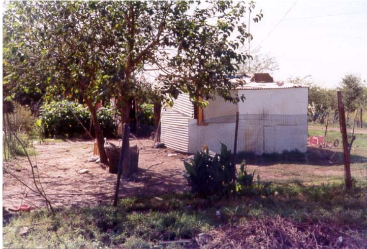
Fotografía 1: Area 5 – zona 2 – residencial de nivel socio-habitacional bajo