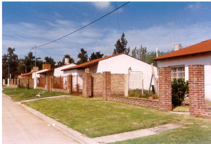
Fotografía 2: Area 7 – zona 3 – residencial de nivel socio-habitacional medio.